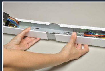
Eclisse de liaison assurant la connexion mécanique sans outil