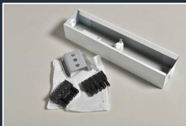
Kit d'alimentation (un par ligne obligatoire)